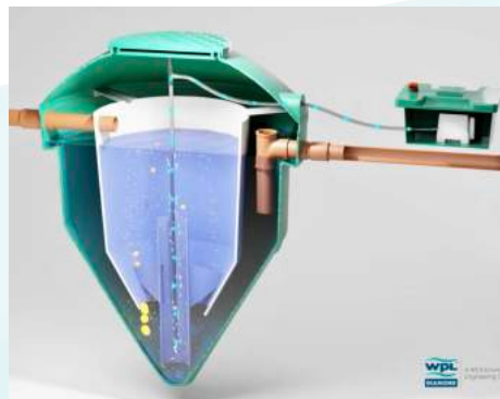
Mise en service DIY*